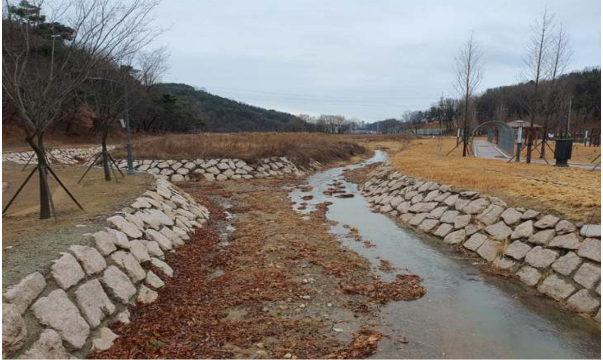
설 명 2단계(1차) 조성사진 (후)